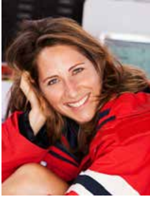
Maud FONTENOY, navigatrice